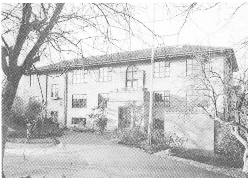
Tinghøj opført 1938.

Rammerne for Kolding Børne- og Ungdomspension viste sig hurtigt at være for snævre. Der manglede især plads til unge. Vi arbejdede længe med planer om en tilbygning på Tingvejen, men dette blev forkastet, og i stedet fik bestyrelsen tilbud om at overtage spædbørnshjemmet Fuglehøj, Dyrehavevej 101. Denne kønne bygning havde efter en grundig gennemgang netop de bygningsmæssige rammer, vi kunne ønske os. Vi kunne flytte ind i vores nye afdeling på Fuglehøj i 1976. Hermed var der skabt mulighed for at modtage mødre med børn.