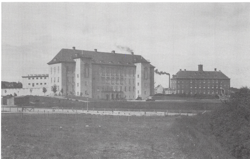
Domhuset, indviet 1921.