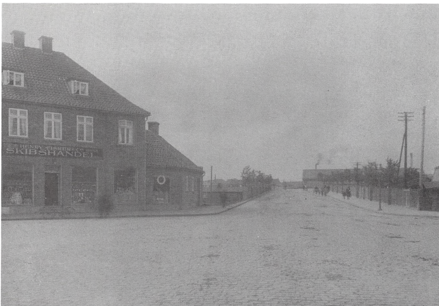
Sdr. Havnegade, anlagt på det tidligere åløb, der blev forlagt mod syd. Aforlægningen og vejarbejderne i forbindelse hermed var afsluttet o. 1920.