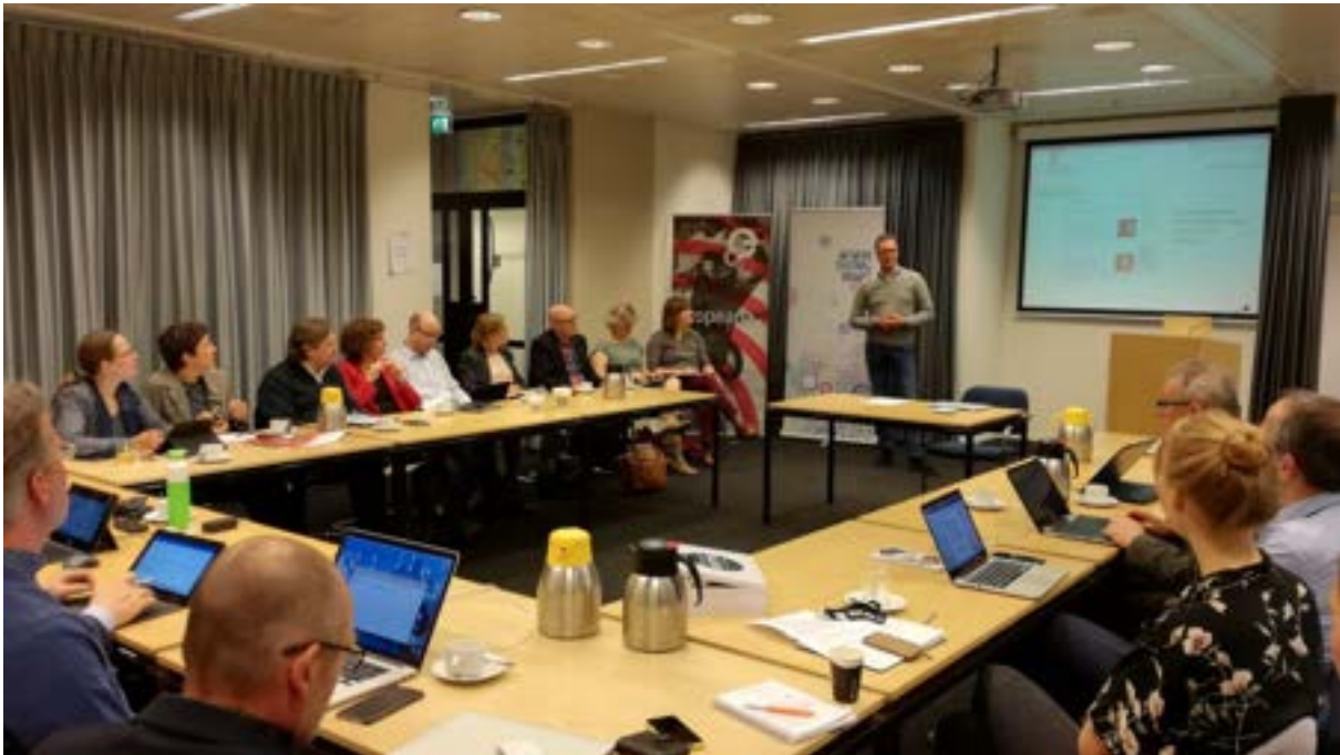
Foto: Workshop tijdens de Week van het Digitaal Erfgoed, april 2017