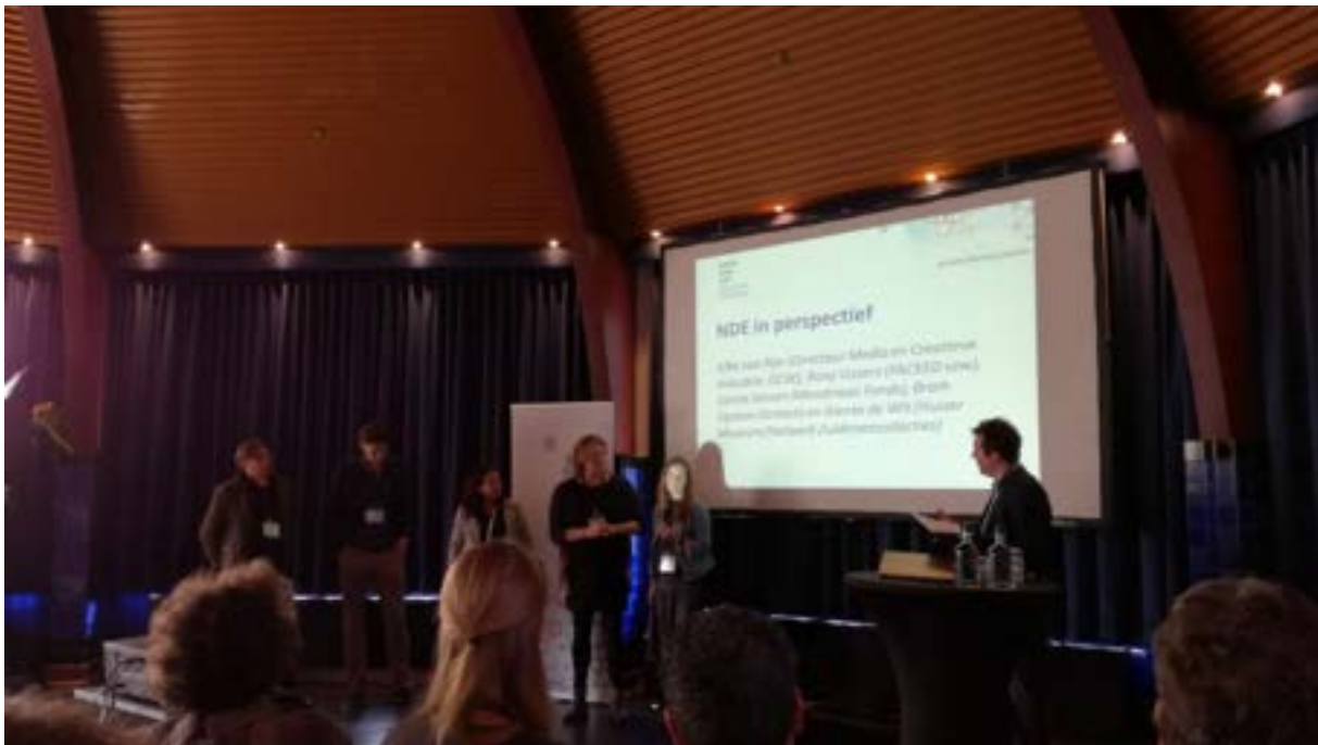
Foto: Paneldiscussie tijdens de NDE-conferentie tijdens de Week van het Digitaal Erfgoed

Verder hebben diverse medewerkers van DEN bijdragen geleverd aan de praktische organisatie en ondersteuning bij diverse NDE-evenementen, zoals de Week van het Digitaal Erfgoed waarin de NDE-conferentie van april 2017 plaatsvond.