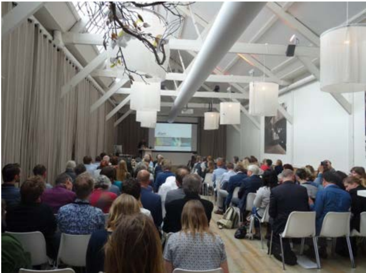
Foto: Conferentie Digitalisering van Cultuur en Erfgoed, mei 2017

Tot slot is een tweede website ( digitalecultuur.nl ) gelanceerd die specifiek gericht is op cultuurproducerende instellingen.