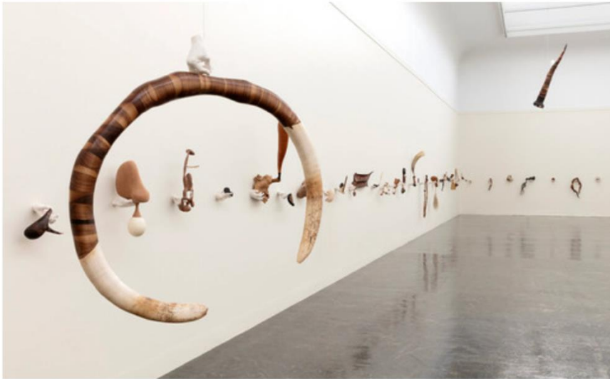
Ahmed Umar, «Glowing Phalanges», Kunsternes Hus 2023.