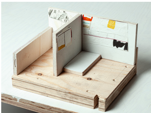
Ragna Bley: Stranger's Eye 03.06.–07.08.