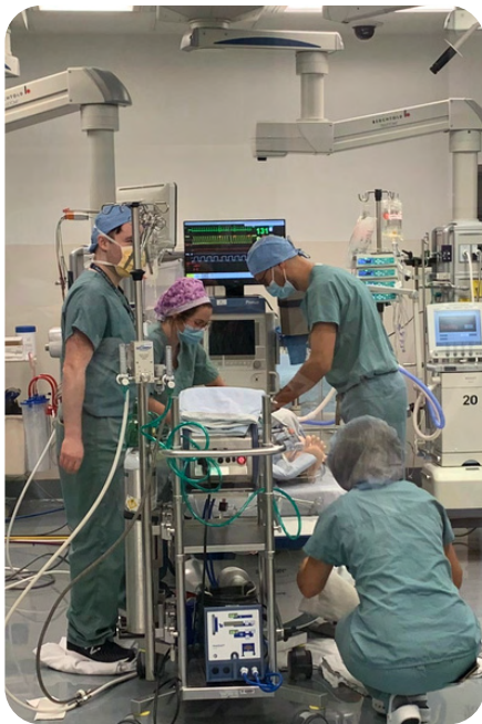
Le personnel du CUSM travaille dans la salle d'opération.