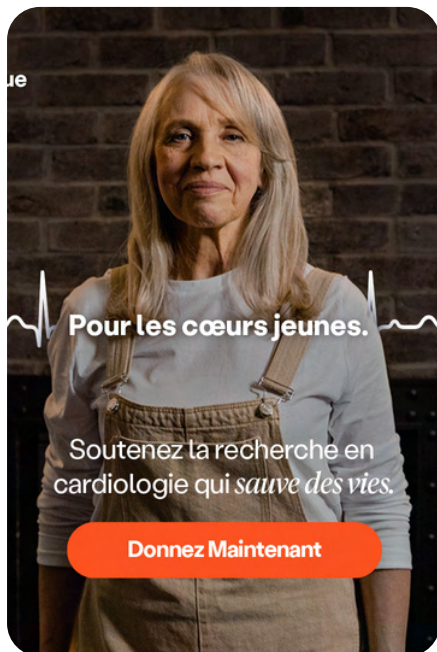
Une image forte de la campagne Pour chaque cœur.