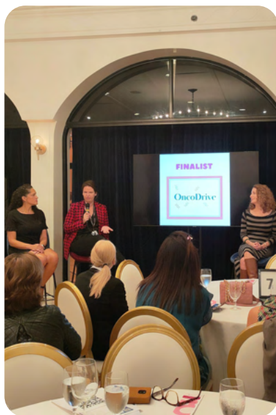
Des membres du personnel de la Fondation du CUSM présentent trois projets inspirants sur la santé des femmes à 100+ femmes de cœur Montréal.