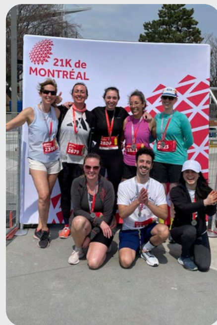
L'équipe de coureurs du Service des maladies virales chroniques montre ses médailles.