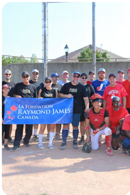
Les Lobes de l'ITM ont remporté une victoire surprise contre les Bulls de Raymond James.