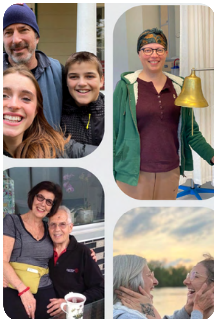
Les ambassadeurs de notre campagne 2023 pour la Journée mondiale contre le cancer.