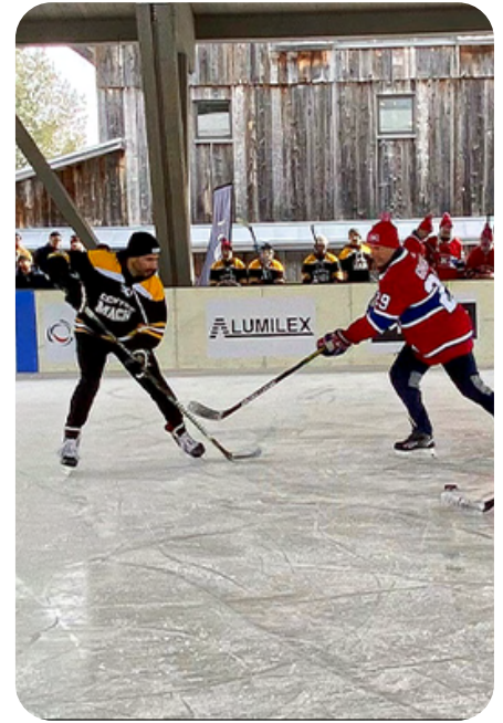
Les anciens Canadiens et de généreux donateurs s'affrontent dans un match amical en plein air.