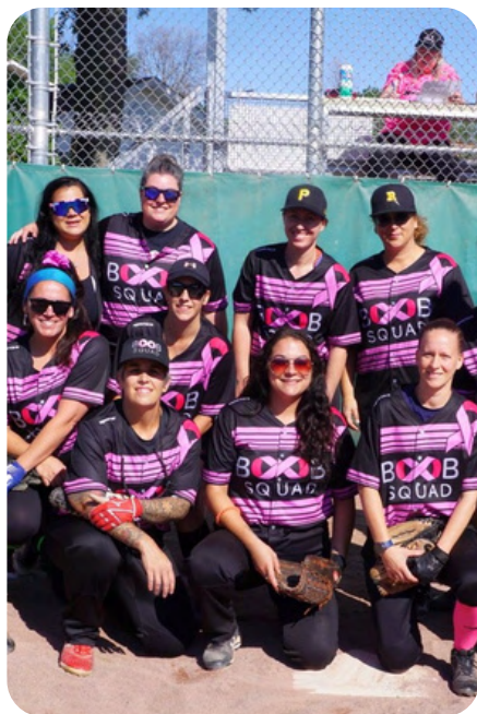
L'équipe de balle-molle Boob Squad.