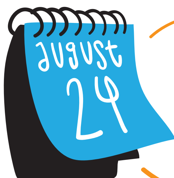
ILLUSTRATION with Ruba Al Araji

Taking aspects from their daily lives and experiences, students will create unique sketchbooks that they can take away and continue to add and build on. Students are encouraged to collect everyday materials around them and use those to enhance and develop their own style.