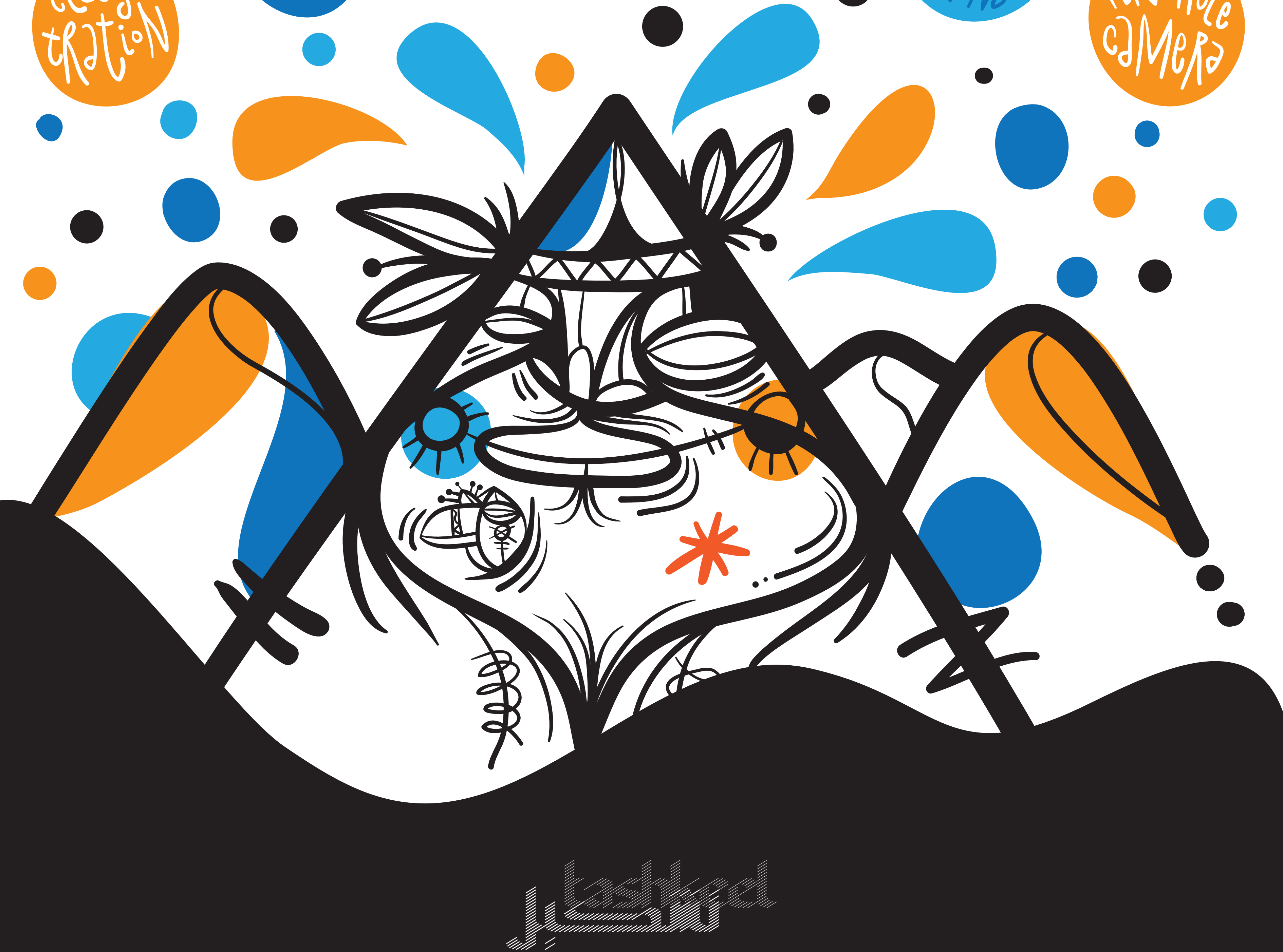
Illustration by [unclear]