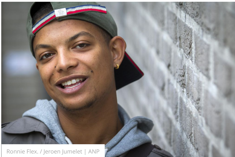
Ronnie Flex.