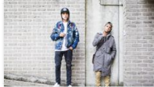
Ronnie Flex is trots op wereldsucces Drank & Drugs