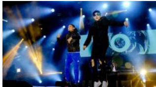
Lil' Kleine: Coke door je neus, gewoon niet doen