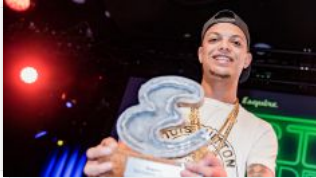
FILMPJE: Ronnie Flex laat zijn Feyenoordhart spreken