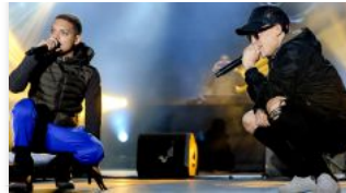
Nieuw nummer Lil' Kleine en Ronnie Flex