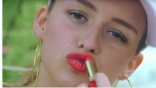
Ronnie Flex vindt alle parodieën Drank & Drugs tof