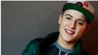
Lil' Kleine breekt records met debuutalbum WOP