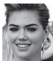
Kate Upton

Waarschijnlijk is het een kwestie geweest van slim raden van gebruikersnaam en wachtwoorden. Daarvoor lijkt de hacker gebruik te hebben gemaakt van een lek in de Zoek-mijn-iPhone-