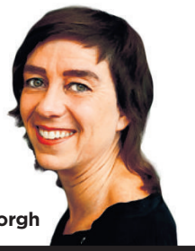
Wendelien van Oldenborgh

Het NoordBrabants Museum in Den Bosch toont een selectie uit het oeuvre van ontwerpster Pieke Bergmans (1978). Twintig werken zijn geëxposeerd, waaronder de Light Blubs waarmee ze bij een groter publiek bekend raakte. De tentoonstelling duurt tot en met 11 januari 2015.