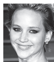
Jennifer Lawrence

dienst. Die dienst, die het mogelijk maakt om een verloren telefoon terug te vinden met een andere telefoon, kan door elke kwaadwillende worden gebruikt. De zwakke plek is dat daarbij,